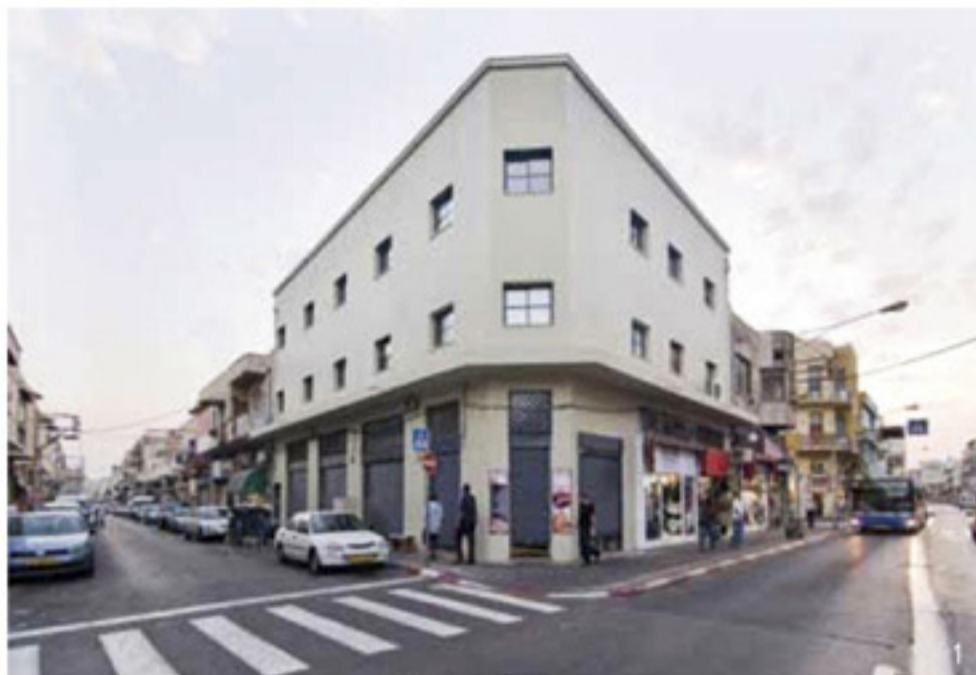
מאת | גילי אריאל אדריכלות | Studio Dash